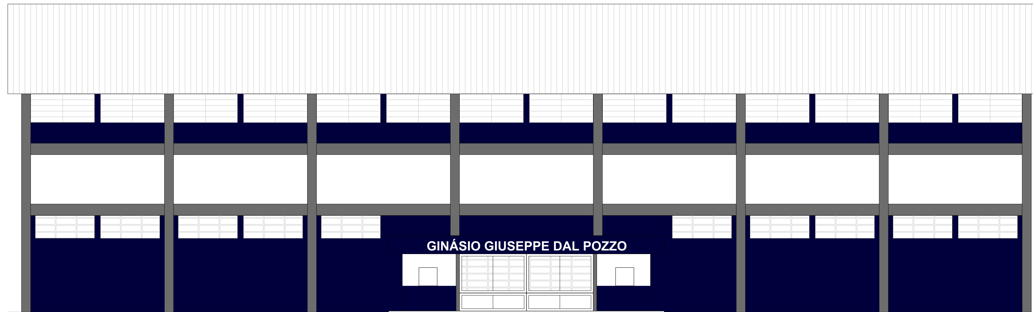
ELEVAÇÃO FRONTAL Escala 1/100